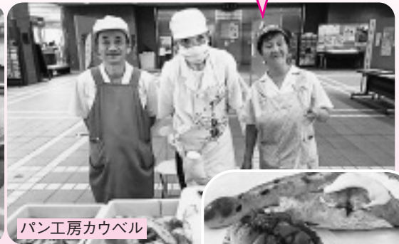
パン工房カウベル