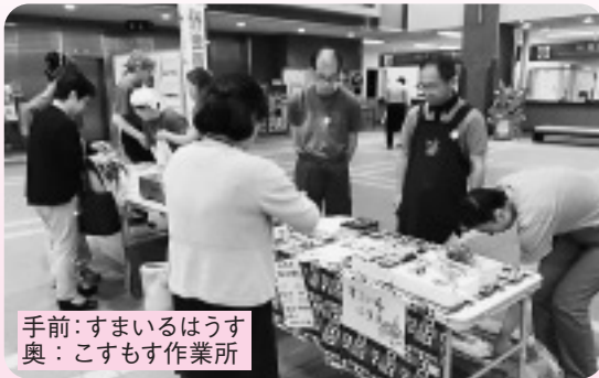
手前:すまいるはうす 奥:こすもす作業所

障がいのある方は、それぞれの希望する暮らしに合わせ、施設や作業所に通い、生活を送られています。そこでは、地域で生活を送るための準備を行ったり、一般企業での就労に向け必要な訓練の実施等を行っています。また、作業所商品の販売や行事への参加を通し、地域との交流をはかっています。2ページでは、障がい者の身体能力や生活能力の向上等を目的とする鶴ヶ島市立障害者生活介護施設いきいちごについてご紹介します。