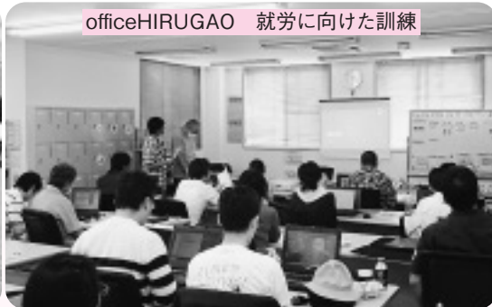
officeHIRUGAO 就労に向けた訓練

毎週金曜日には、鶴ヶ島市役所1階ロビーにて各作業所商品(パン・野菜・小物等)の販売を行っています。ぜひ、お気軽にお越しください。