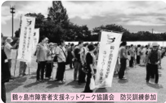
鶴ヶ島市障害者支援ネットワーク協議会 防災訓練参加

地域では、子どもや高齢者、障がい者、 さまざまな人がともに暮らしています。 今回は、市内でいきいきと生活を送る 障がいのある方の暮らしに触れてみます。