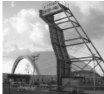
岡山ドームとアクションスポーツパーク

民間会社に対し、行政監査はおよばず、議会のチェックも不十分です。したがってエックス社の財務体質が改善されたかどうかは不明の