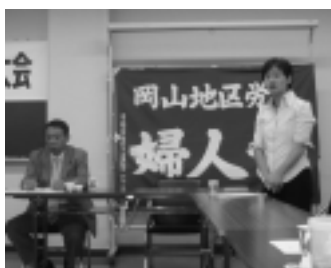
9月25日 第21回岡山地区労働女性協議会定期大会