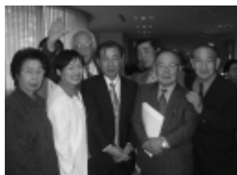
10月5日 第34回岡山貯金事務センター後楽会