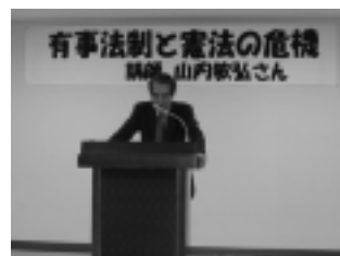
11月15日 平和憲法の会総会講演会