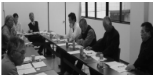
11月28日 第3回合併情報交換会(山陽町)

政が好転することはありません。今後10年間で、借金残高3000億円が4000億円程度増加するとしています。岡山市の財源は市の収入が半分しかなく、あとは国・県の交付金・補助金に頼っていますが、国の財政も