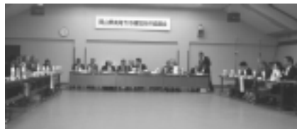
合併協議会(法定)設置