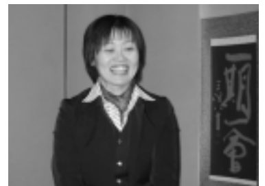
3月26日 2月議会報告会(赤田)