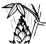
3月18日 岡山市立幡多小学校卒業式(高屋)