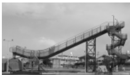
アクションスポーツパーク

金を出さないことを前提に話をするから、まあアレでもいいかというふうになるんです。やっぱり自腹でやる話にしないと、みんな真剣に「あの土地をどう利用するのがベストか」という根本的な問題を考えないのではないのでしょうか。(K)