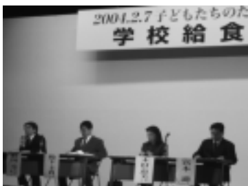
2月7日 学校給食全国集会(東京)