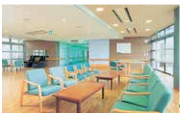
中央デイコーナー