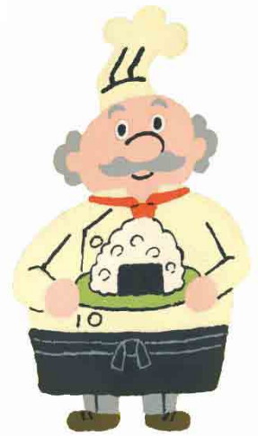
いぶくろおじさん