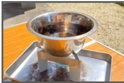
①ボウルを五徳にセットして固形燃料を下に置く。