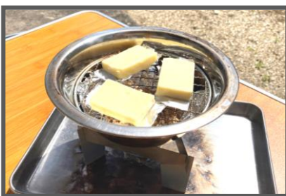
③網をのせ、その上にチーズを置く。 チーズのアルミは全部はがさず底になる部分は残すとくっつかない。