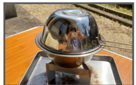
④ふたになるボウルをかぶせる。 固形燃料に火をつけ隙間から煙が出てきたら2分ほど待つ。