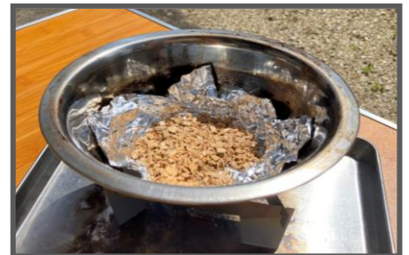
②アルミホイルを敷いてその上に燻製チップ(大きじ1)を入れる