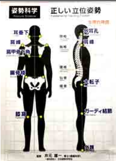
一番疲れない、身体の可動しやすい正しい姿勢(生理弯曲のある脊柱)

そして、骨格がまだ未発達の子どもの健やかな成長のため、「姿勢教育」にも力を入れています。今年度、姿勢の専門家から皆さんに、「姿勢についての知識」をお伝えしようと思います。